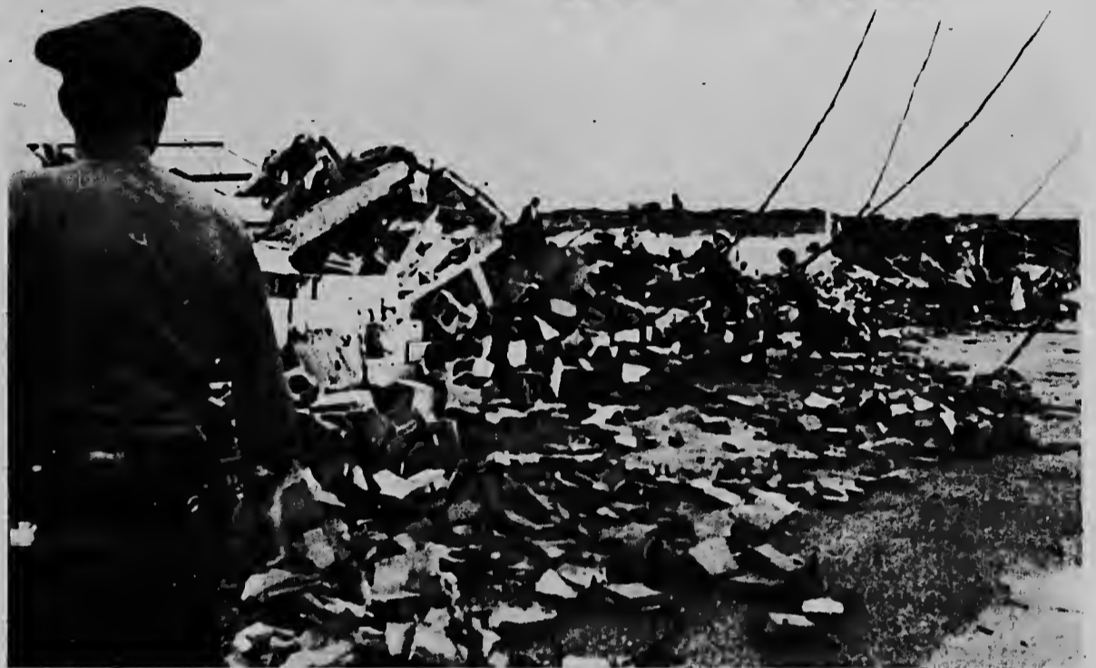
JACKSON, MISS--Trahadornan ta buscando victimanan, den un centro comercial, na unda tornadonan a causa hopi daño na Jackson y Mississippi. Varios persona a perde nan bida y hopi a keda sin cas.

Na Fort Payne (Alabama) numeroso famianan mester a bandona nan cas pa hui consecucionnan